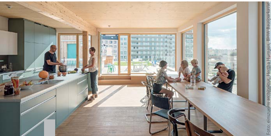
Neue Wohnkonzepte berücksichtigen das Bedürfnis nach Gemeinschaft und nach Individualität durch eine andere Organisation der Räume.