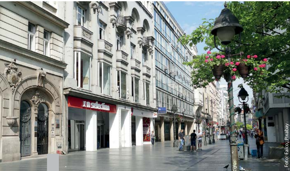
Bereits vor Corona herrschte in vielen Städten das Bewusstsein, dass eine Transformation der Innenstädte nötig sein würde.

Der Veränderungsprozess der Innenstädte hat schon vor einigen Jahren eingesetzt. In der Coronapandemie wird er deutlicher sichtbar: Die Verteilung des öffentlichen Raums in den Städten entspricht nicht mehr den Anforderungen an eine klimagerechte Stadt. Die innerstädtische Mobilität ist zu sehr am Leitbild des motorisierten Individualverkehrs ausgerichtet. Gewerbliche Nutzungen haben zu einem eintönigen Stadtbild geführt. Der Einzelhandel ist zu sehr durch Filialisten geprägt, die Gastronomie durch immer ähnlichere Imbissläden. Die Fußgängerzonen der 70er- und 80er-Jahre prägen wichtige Teile des Stadtbildes und wirken abends wie ausgestorben. Eine Aufwertung der Aufenthaltsqualität ist überfällig. Die Funktionalität der Innenstädte ist ein öffentliches Gut. Alternative Nutzungen spielen eine zentrale Rolle, um Innenstädte belebt zu halten. Die Umnutzung von Büroflächen könnte eine adäquate Möglichkeit sein, um bezahlbaren Wohnraum zu schaffen. Erdgeschosslagen eignen sich für kulturelle und soziale Nutzungen oder für neue Formen der urbanen Produktion. Die Stadt der Zukunft ist auf jeden Fall multifunktional.