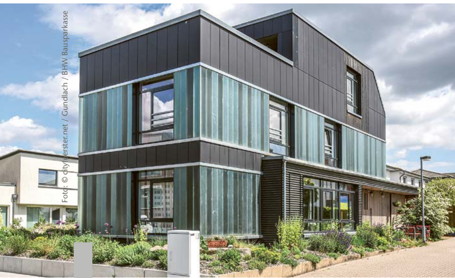
Dieses Haus in Hannover besteht komplett aus recycelten Materialien.

Klinker aus alten Dachziegeln, Fußböden aus aufbereitetem Altholz, Markisen und Rollos aus alten PET-Flaschen – der Markt für Recyclingprodukte boomt. Beim Bauen und Modernisieren gibt es bereits ein breites Angebot im Fach- und Onlinehandel. Was alles möglich ist, zeigt das Recyclinghaus in Hannover. Erstmals in Deutschland besteht ein Einfamilienhaus vollständig aus wiederverwendeten oder recycelten Baustoffen. Für die Fassade wurden gebrauchte Faserzementplatten und Holzplatten alter Saunabänke verwendet, für den Terrazzoboden alte Ziegelsteine. Die Fenster stammen aus dem Abbruch eines ehemaligen Fabrikgebäudes.