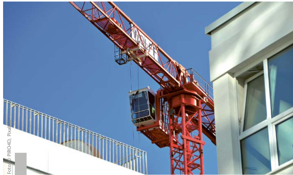
Die Kräne sollen sich wieder drehen – der Bedarf an neuen Wohnungen ist groß.

Das Bundeskabinett hat den Entwurf eines Gesetzes zur Beschleunigung des Wohnungsbaus und zur Wohnraumsicherung beschlossen – den sogenannten Bau-Turbo. Damit erhalten Kommunen, Bauunternehmen und Bauwillige die Möglichkeit, schneller und flexibler zu bauen. Der Gesetzentwurf zielt darauf ab, das Baugesetzbuch zu ändern, um Wohnungsbauvorhaben zu erleichtern und zu beschleunigen. Aus durchschnittlich fünf Jahren Planungszeit sollen dann nur noch zwei Monate werden. Der „Bau-Turbo“ soll für Menschen, die besonders stark vom Wohnungsmangel betroffen sind, wie beispielsweise Familien, Auszubildende, Studierende, ältere Menschen und Menschen mit geringem Einkommen, bezahlbaren Wohnraum schaffen. Die wichtigsten Neuerungen: Ein bis zum 31. Dezember 2030 befristetes Abweichen von bauplanungsrechtlichen Vorschriften soll erlaubt sein. Eine intensivere Wohnbebauung soll ermöglicht werden, beispielsweise durch Aufstockung, Anbauten oder das Bauen in der zweiten Reihe. Den aktuellen Stand des Gesetzgebungsverfahrens finden Sie unter www.bmwsb.bund.de/wohnungsbau-turbo .